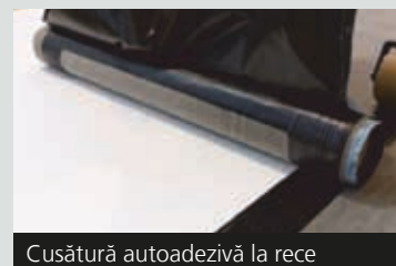
Cusătură autoadezivă la rece