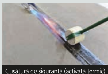
Cusătură de siguranță (activată termic)