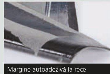
Margine autoadezivă la rece