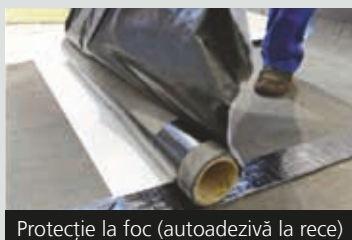
Protecție la foc (autoadezivă la rece)