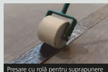
Presare cu rolă pentru suprapunere