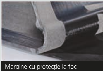
Margine cu protecție la foc